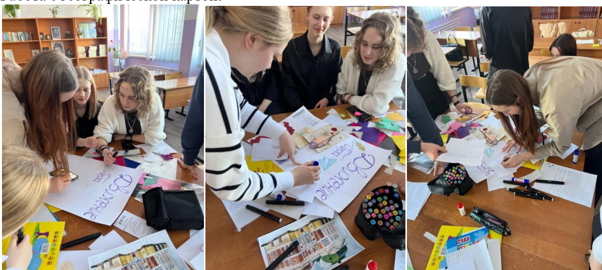
Выполнение стенгазеты как основного задания