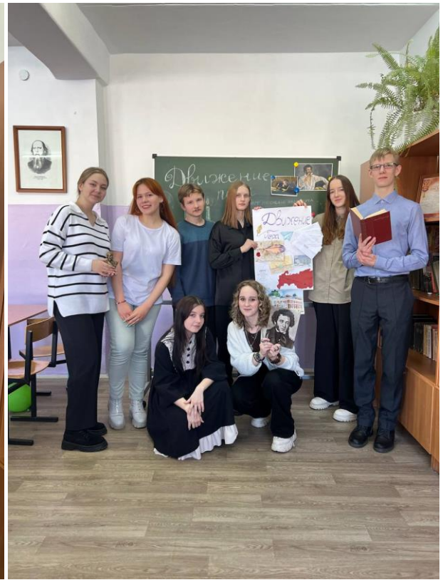
Путешествие подошло к концу. Стенгазета и финальная фотография с участниками квеста.