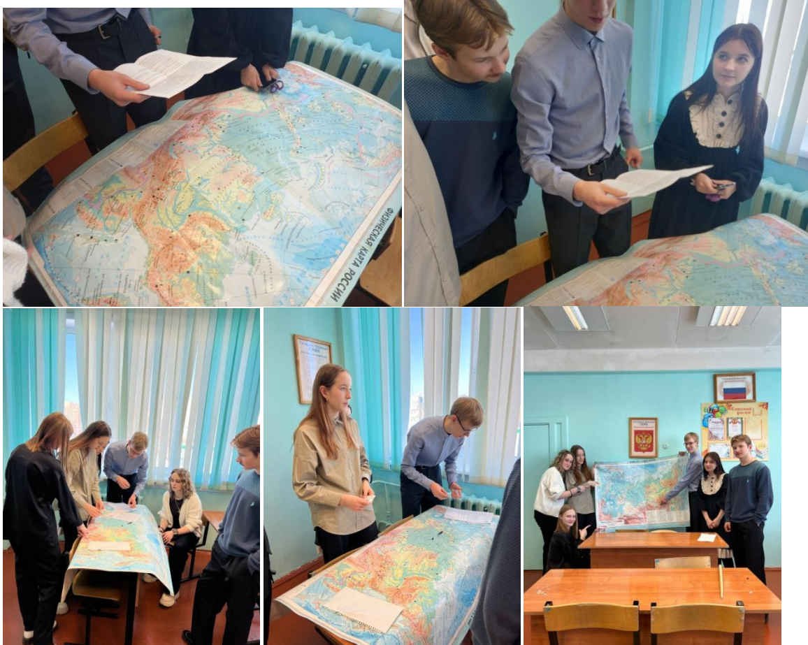
Часть 9. Впрочем, звонит телефон Работа с географической картой.